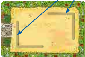
Vorderseite: Einfache Variante