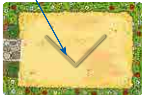
Back: variation for expert stacking heroes